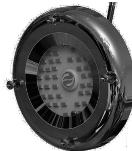
LSPOR48 S 50W